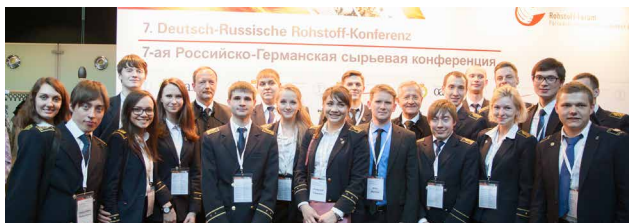
Nachwuchswissenschaftler auf der 7. Deutsch-Russischen Rohstoff-Konferenz